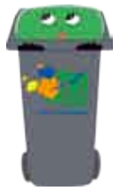
ordures ménagères Jours de collecte des ordures ménagères