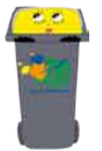
collecte sélective Jours de collecte sélective des emballages recyclables

Toutes les collectes sont organisées l'après-midi entre 13h30 et 22h15. Vous avez donc jusqu'à 13h pour sortir vos bacs. Toutefois, nous vous conseillons de les sortir la veille au soir. Pour la collecte, merci de bien respecter le point de présentation et de présenter vos bacs les poignées dirigées vers la chaussée. Les collectes prévues les jours fériés sont assurées le mercredi de la semaine correspondante.